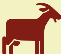
ovins et caprins