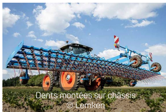
Dents montées sur châssis © Lemken