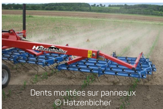
Dents montées sur panneaux © Hatzenbichler

Pour limiter l'usure des dents en terre caillouteuse ou en cas d'usage intensif de la herse étrille, il est possible d'opter pour des dents renforcées par des plaquettes en carbure ou en tungstène.