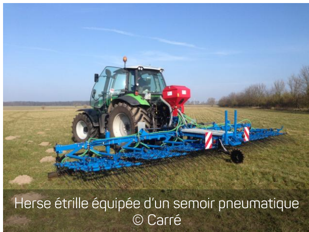
Herse étrille équipée d'un semoir pneumatique

Sur une herse à panneaux, ajustez différemment l'inclinaison de chaque panneau. Vérifiez ensuite le travail de chacun et choisissez le réglage le plus efficace.